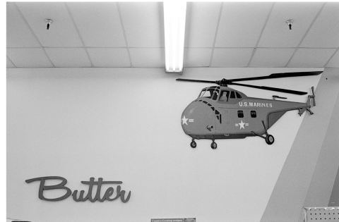
Allan Sekula Guns and Butter (El Toro 1975) , 1973-1977 gelatin silver prints, 28 x 36 cm (each) with frame 76 x 102 cm ed. 5 + 1 AP inv. SEKU77001

Both before leaving California for New York in 1974 and after returning the next year, I planned and photographed a number of smaller sequential projects, often involving some sort of staging, either deadpan or comic. These were never printed. The works fall between my works from the earlier 70s, such as Aerospace Folktales and projects from the late 70s, such as School Is a Factory.